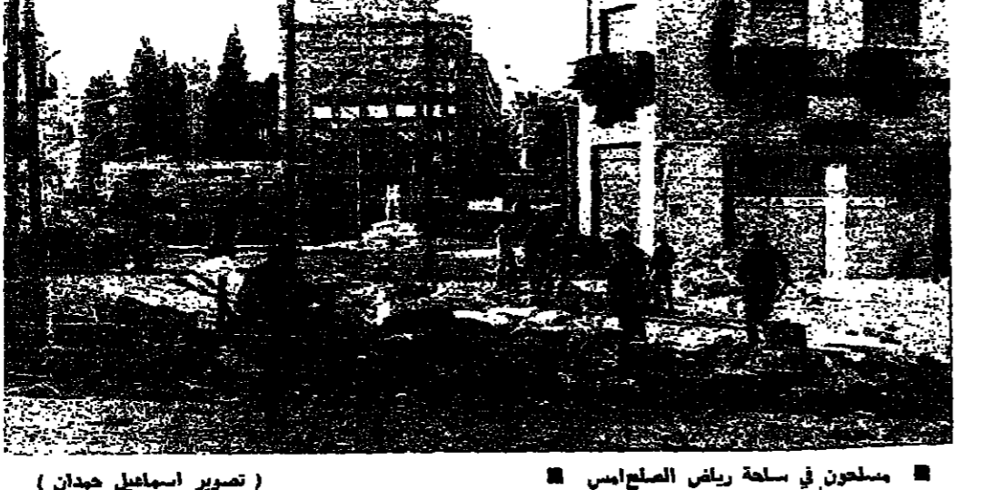
مسجونون في ساحة رياض الصلح امس